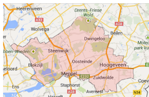
SWV op de kaart